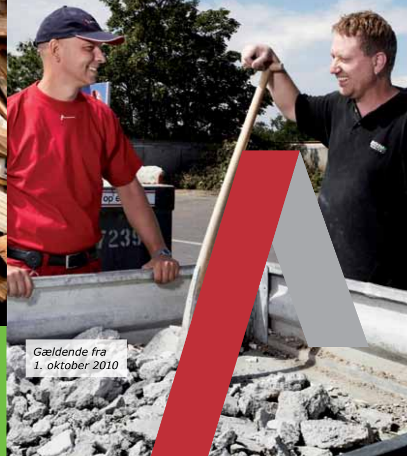
Gældende fra 1. oktober 2010